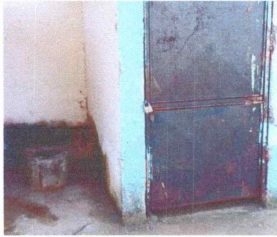
Foto7: Sustitución de letrinas en mal estado por nuevas.