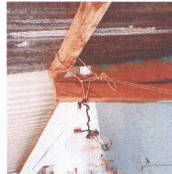
Foto 10: Sustitución de estructura de madera por metal, modulo 4.